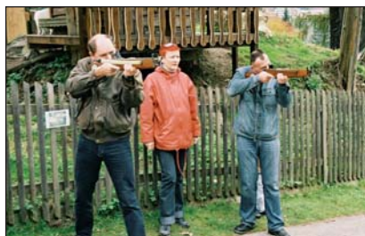
Wettbewerb im Armbrustschießen