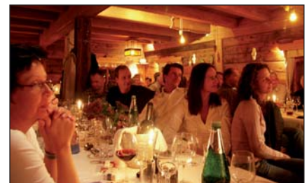
Hüttenabend beim Seewirt