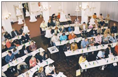
Seminar zum Thema e-Card